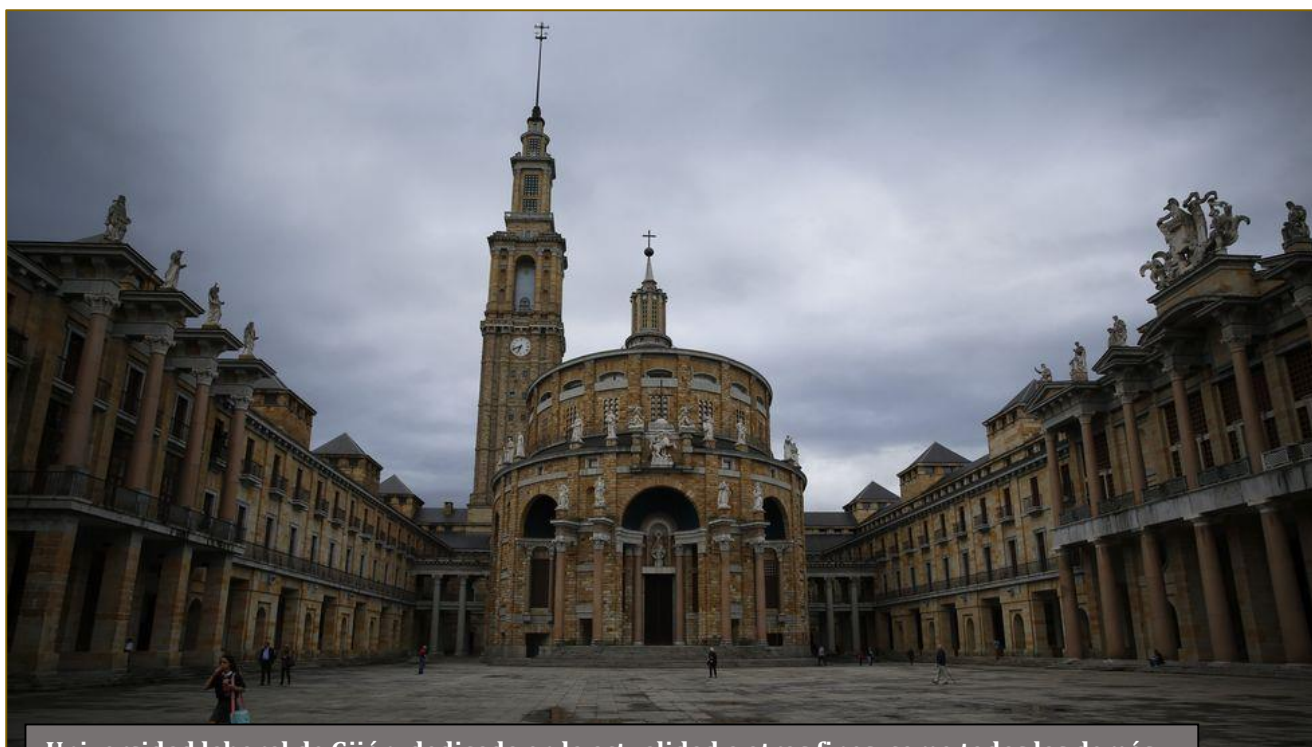
Universidad laboral de Gijón, dedicada en la actualidad a otros fines, como todas las demás