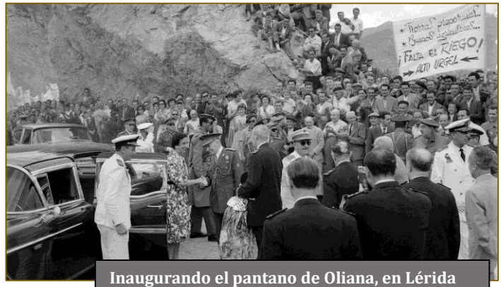
Inaugurando el pantano de Oliana, en Lérida

«Los Españoles somos fuertes cuando permanecemos unidos». –Franco ante las cortes en 1971.